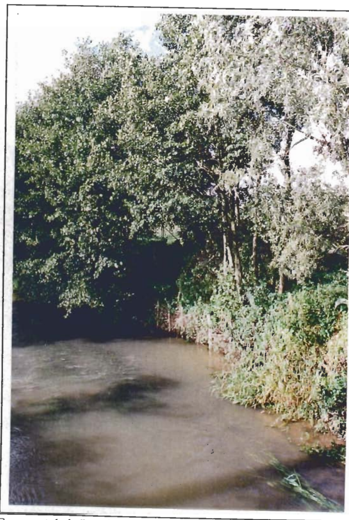
En amont de la Lys rivière, près de Fruges.

Ces cours d'eau, bien que relativement propres, nécessitent des prestations d'entretien, notamment en ce qui concerne la gestion de la ripisylve.